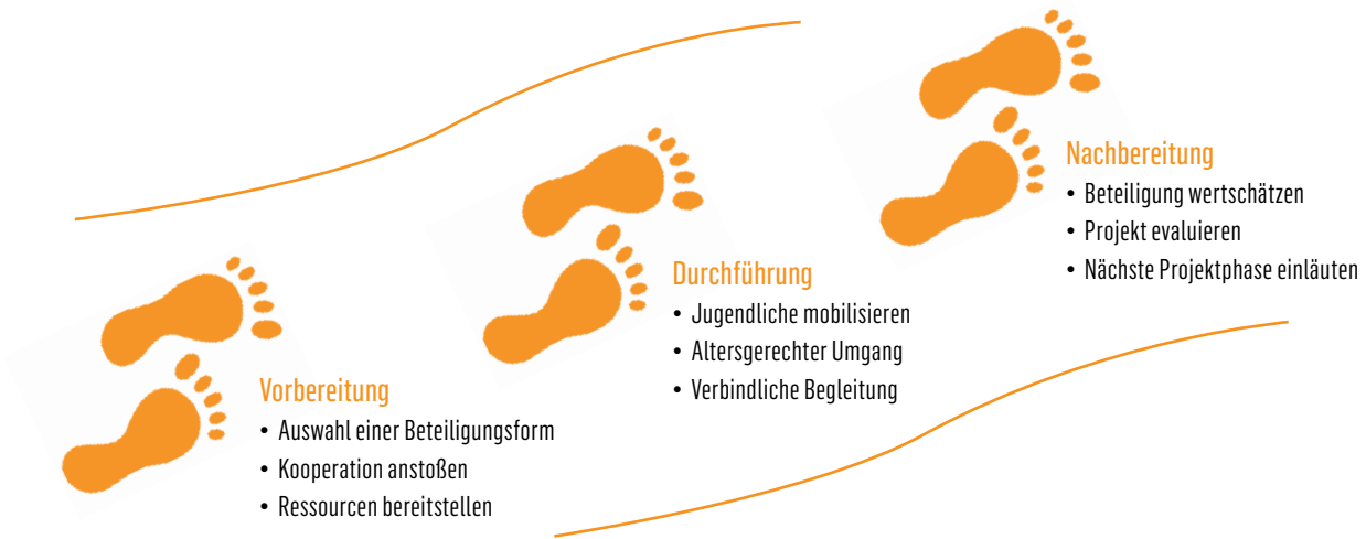
► Abb. 2: Die drei wesentlichen Schritte eines Jugendbeteiligungsprozesses